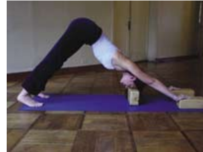
adho mukha svasana